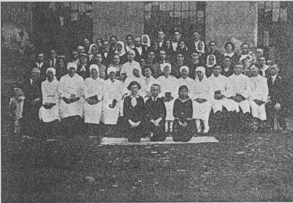
Miskolci és környéki fehérruhások.

akik önmaguknak az Istennek ama Fiát és meggyalázzák Őt.“ (Zsid. 6, 4—6.)