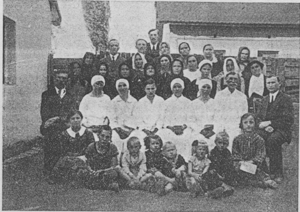
Kép a debreceni alámerítkezőkről.