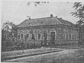
Kispesti (Erzsébet-tér 11.) gyülekezetünk képe, melynek udvarán konferenciánkat tartottuk.

Oh, hol van egy ilyen közönség? Hol van egy gyülekezet, ahol nincs baj, hívás a sátán be nem tenné a lábait? Nincs, nincs e földön sehoh. Pedig hány lélek van, aki keresi a tökéletes gyüle-